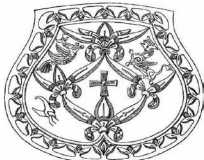
119. ábra. Esetet tarsolylemez hunfogaló lovas sírből Bezdéd-ről (Szabolcs m.). A hőrtarsoly is teljesen épen megmaradt.