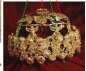
NIMRUD koronája - Teherán →